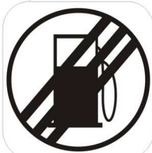
Sfârșit zonă alimentare