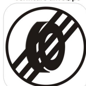
Sfârșit zonă marcare/ verificare anvelope