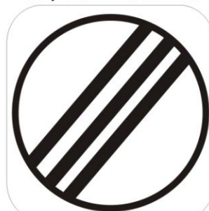
Sfârșit zonă de control