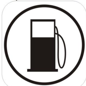
Început zonă alimentare