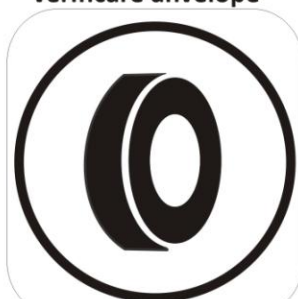
Început zonă marcare/ verificare anvelope

Început zonă ambulanță : galben Ambulanță : albastru