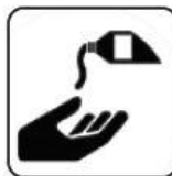
DEZINFECTARE PE MĂINI