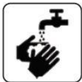
SPĂLARE FRECVENTĂ PE MĂINI CU APĂ ȘI SĂPUN