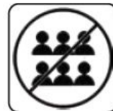
EVITAREA SPAȚIILOR AGLOMERATE