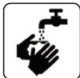
SPĂLARE FRECVENTĂ PE MĂINI CU APĂ ȘI SĂPUN