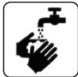
SPĂLARE FRECVENTĂ PE MĂINI CU APĂ ȘI SĂPUN