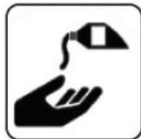
DEZINFECTARE PE MĂINI