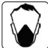
UTILIZAREA MĂȘTII DE PROTECȚIE