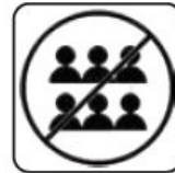
EVITAREA SPAȚIILOR AGLOMERATE