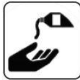
DEZINFECTARE PE MĂINI