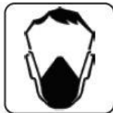
UTILIZAREA MĂȘTII DE PROTECȚIE