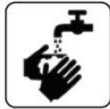
SPĂLARE FRECVENTĂ PE MĂINI CU APĂ ȘI SĂPUN