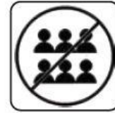
EVITAREA SPAȚIILOR AGLOMERATE