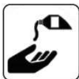
DEZINFECTARE PE MĂINI