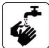
SPĂLARE FRECVENTĂ PE MĂINI CU APĂ ȘI SĂPUN