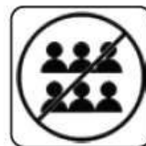
EVITAREA SPAȚIILOR AGLOMERATE